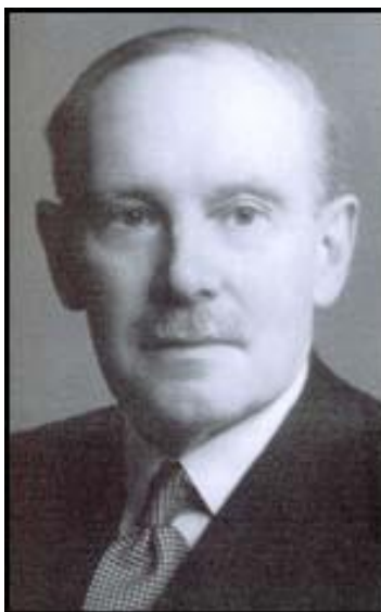
Сэр Стюарт Мензис (1890-1968)