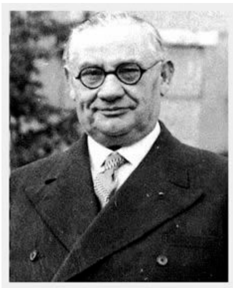
Эрнест Бевин (1881-1951)