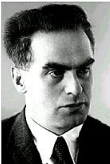
Рудольф Сланский (1901-1952)

Этот двойной агент, сам чешский еврей, передал 9 ноября другое сообщение, подтверждая, что он был назначен управлять «чешской частью операции и будет использовать свою старую сеть». Эти новости дошли до Сталина, который приказал, чтобы его представитель в Праге Анастас Микоян потребовал немедленного ареста Сланского. Одновременно компрометирующие письма, содержащие таинственные сообщения, отправили предполагаемому посреднику в Чехословакии, где они были перехвачены и скопированы, и Радио «Свободная Европа» начала передавать какие-то неуклюже закодированные сигналы. Последним штрихом было приглашение определенным лидерам чешского эмигрантского сообщества прибыть на американский военный аэродром близ Мюнхена, чтобы приветствовать какого-то важного гостя.