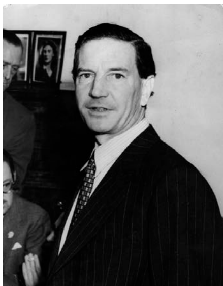
Ким Филби (1912-1988)

Еще в сентябре 1945 года Филби получил от офицера ГРУ полковника Константина Волкова предложение дезертировать на сторону англичан (ошибка автора, Волков служил не в ГРУ, а в госбезопасности – прим. перев.). Волков в то время работал под консульским прикрытием в Стамбуле. Когда Филби поручили деликатную задачу ведения переговоров о сроках и обеспечении безопасного прибытия Волкова на Запад, он немедленно сообщил об этом своим советским контактам, которые уже позаботились о том, чтобы несчастный Волков был просто связанным доставлен на борту самолета домой, где он и был казнен. Представляется вероятным, учитывая список достижений Филби в устранении потенциально опасных перебежчиков, что он проинформировал бы русских о предателе в рядах УВ.