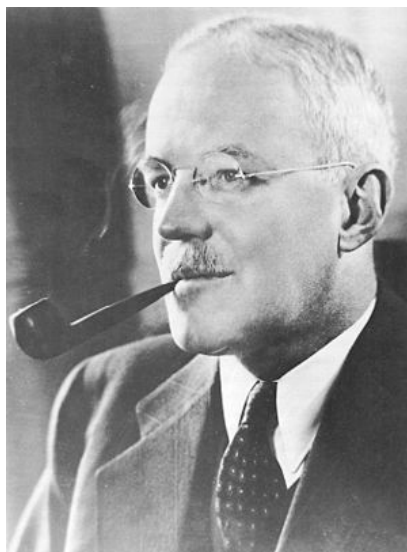
Аллен Даллес (1893-1969)