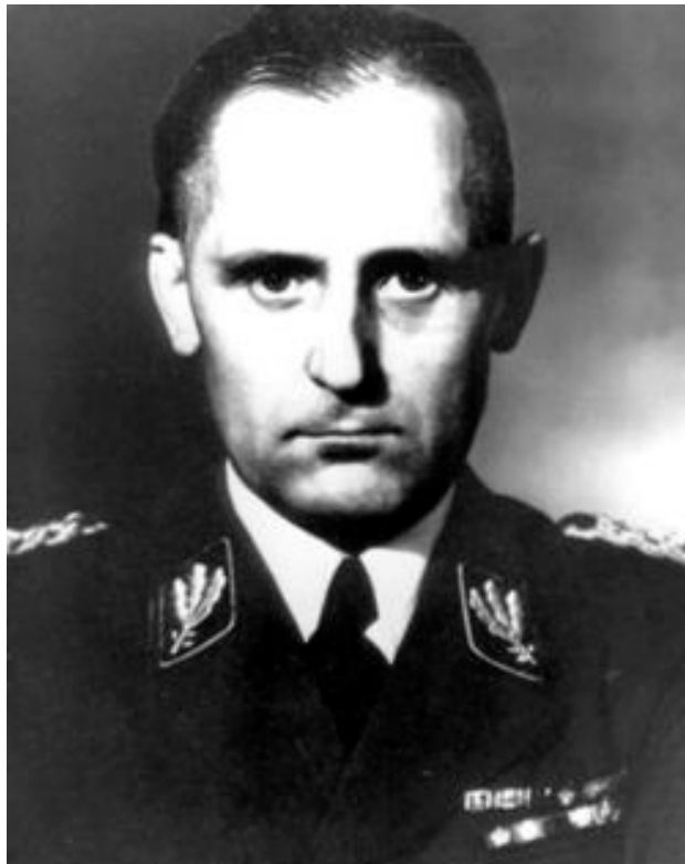
Генрих Мюллер (1900-1945 (?))

новые документы на новую фамилию. Однако никогда не было предъявлено никаких доказательств, позволявших предположить, что он не погиб среди руин Берлина, где позже появилась могила, на надгробном камне которой было указано его имя.