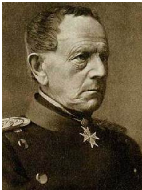
Гельмут Карл Бернхард фон Мольтке (старший) (1800-1891)

Второе поколение стало свидетелем формального признания и принятия оперативного искусства, первоначально прусской армией. И снова движущими силами этого изменения были как идеи, так и технология. Идеи исходили в значительной степени от прусских исследований кампаний Наполеона. Технологические факторы включали понимание фон Мольтке того, что современная тактическая огневая мощь дала возможность осуществлять сражения на окружение и желание использовать возможности железных дорог и телеграфа.